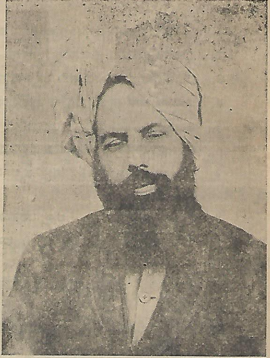
ಅಹ್ಮದಿಯಾ ಸಂಘಟನೆಯ ಸ್ಥಾಪಕ ಹರ್ಷ್‌ರತ್ ಮಿರ್ಜಾ ಗುಲಾಮ್ ಅಹ್ಮದ್

ಈ ಲೋಕದ ವೈಭವವನ್ನೂ ಕೌತುಕವನ್ನೂ ಕಂಡು ನೀವು ಮಾರುಹೋಗದಿರಿ. ಈ ಮನೆಯ ಓಜಸ್ಸನ್ನೂ ತೇಜಸ್ಸನ್ನೂ ಕಂಡು ನೀವು ಗರ್ವಿತರಾಗದಿರಿ. ಏಕೆಂದರೆ ಅದು ಬರೇ ಒಂದು ಮರೀಚಿಕೆ ಮಾತ್ರವಾಗಿದೆ. ಅದರ ಪರ್ಯವಸಾನ ನಾಶವಾಗಿದೆ. ಅದರ ಸಿಹಿ ವಾಸ್ತವದಲ್ಲಿ ಕಹಿಯಾಗಿದೆ. ಅದರ ಲಾಭ ಯಥಾರ್ಥದಲ್ಲಿ ನಷ್ಟವಾಗಿದೆ. ಅದರ ಮಹತ್ವವನ್ನೂ ಪ್ರಭಾವವನ್ನೂ ಅರಸಿ ನಡೆಯುವವನು ಅಸ್ತಪ್ರಹಾರಕ್ಕೆ ಗುರಿಯಾದವನಂತಾಗುವನು. ಅದರ ಕೀರ್ತಿ ಪ್ರತಾಪವನ್ನು ಇಚ್ಛಿಸುವವನು ಮುಳ್ಳಿನಿಂದ ಚುಚ್ಚಿಲ್ಪಟ್ಟವನಂತಾಗುವನು ಅದರ ಸಾಮಗ್ರಿಗಳಲ್ಲಿ ಭ್ರಮಿಸುವವನು ಸತ್ಕರ್ಮಗಳಿಂದ ಅಗಲುವನು. ಲೌಕಿಕದಲ್ಲಿ ಔನ್ನತ್ಯವನ್ನು ಪಡೆಯುವವನು ಸನ್ಮಾರ್ಗದಿಂದ ವಿಮುಖನಾಗುತ್ತಾನೆ. ಖಿನ್ನತೆಯಾಗಿಯೂ ಅದರ ಪ್ರಕಾಶವೆಂಬುದು ಅಂಧಕಾರವಾಗಿದೆ. ನೀವು ಅದಕ್ಕೆ ಅಧೀನರಾಗದಿರಿ. ಏಕೆಂದರೆ ಅದು ಅದರ ಈಜುಗಾರನನ್ನು ಮುಳುಗಿಸಿ ಕೊಲ್ಲುವಂತಹದ್ದೂ ಜಲಪ್ರವಾಹಕ್ಕಿಂತ ಅಪಾರವಾದದ್ದೂ ಆಗಿದೆ. ಮತವಿಲ್ಲದವನ ಹಾಗೆ ನೀವು ಆವೇಶಭರಿತರಾಗಿ ಅದನ್ನು (ಲೋಕವನ್ನು) ನಿಮ್ಮ ಲಕ್ಷ್ಯವಾಗಿಟ್ಟುಕೊಂಡು ವರ್ತಿಸದಿರಿ. ಅದನ್ನು ಮತಕಾರ್ಯದಲ್ಲಿ ಒಬ್ಬ ಸೇವಕನಂತೆ ಲಲನೆ ಮಿತ್ರನನ್ನಾಗಿ ಮಾಡಿರಿ.