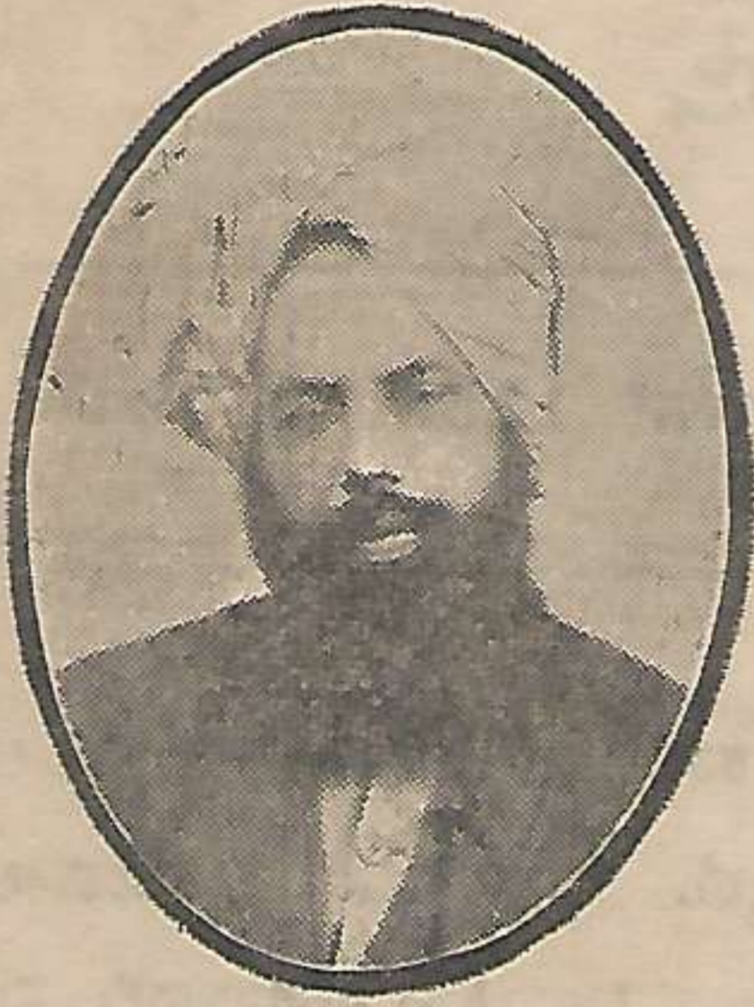
ಅಹ್ಮದಿಯಾ ಸಂಘಟನೆಯ ಸ್ಥಾಪಕ ಹರ್ಯೂರತ್ ಮಿರ್ಜಾ ಗುಲಾನಾ ಅಹ್ಮದ್

ಈ ಲೋಕದ ಶಾಪಗಳ ಕುರಿತು ನೀವು ಹೆದರದಿರಿ. ಅವು ಬೇಗನೆ ನಿವಾರಿಸಲ್ಪಡುವಂತಹವು. ಅವು ಹೊಗೆಯಂತಿದ್ದು ನಿಮ್ಮ ಹಗಲನ್ನು ಇರುಳನ್ನಾಗಿ ಪರಿವರ್ತಿಸಲು ಅವಕ್ಕೆ ಸಾಧ್ಯವಿಲ್ಲ. ಆದರೆ ಮೇಲಿನ ಲೋಕದಿಂದ ಬರುವ ದೈವಶಾಪಕ್ಕೆ ಹೆದರಿರಿ; ಅದು ಇಹ ದಲ್ಲೂ ಪರದಲ್ಲೂ ವಿನಾಶಕಾರಿಯಾಗಿದೆ. ಅದಕ್ಕೆ ಗುರಿಯಾಗುವವರು ಎರಡು ಲೋಕಗಳಲ್ಲೂ ನಷ್ಟವನ್ನು ಅನುಭವಿಸುವರು. ಕಪಟ ಭಕ್ತಿಯಿಂದ ರಕ್ಷಿಸಲ್ಪಡಬಹುದೆಂದು ನೀವು ಭಾವಿಸಬೇಡಿರಿ. ಕಾರಣ ವೇನೆಂದರೆ ನಿಮ್ಮ ಸ್ವಷ್ಟಿಕರ್ತ ನಿಮ್ಮ ಹೃದಯದ ಅಡಿಭಾಗದಲ್ಲಿ ನೆಲೆಸಿರುವ ರಹಸ್ಯಗಳನ್ನು ಸಹ ಕಾಣುವನು. ಅವನನ್ನು ವಂಚಿಸಲು ನಿಮಗೆ ಸಾಧ್ಯವಿದೆಯೇ? ಆದುದರಿಂದ ನೀವು ಅವನ ಮುಂದೆ ನೇರಾಗಿ ನಿಲ್ಲಿರಿ. ನಿಮ್ಮ ಹೃದಯಗಳಲ್ಲಿರುವ ಕಲ್ಮಶಗಳನ್ನೆಲ್ಲಾ ಸ್ವಚ್ಛಗೊಳಿಸಿ ಅವನ್ನು ಯಾವಾಗಲೂ ಶುಚಿಯಾಗಿಡಿರಿ. ಅಲ್ಪವಾವ ಒಂದು ಕಲೆ ನಿಮ್ಮಲ್ಲಿ ಬಾಕಿಯಾಗುವುದಾದರೆ, ಅದು ನಿಮ್ಮ ಬೆಳಕನ್ನು ನಂದಿಸಿ, ಅನಂತರ ಸರ್ವವನ್ನೂ ಅಧಿಕಾರಮಯವನ್ನಾಗಿ ಮಾಡುವುದು.