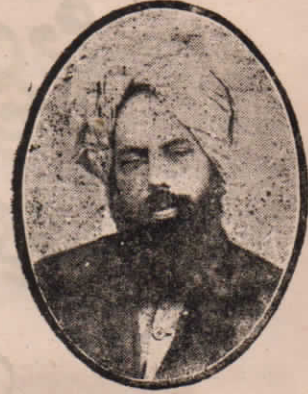
ಅಹ್ಮದಿಯಾ ಸಂಘಟನೆಯ ಸ್ಥಾಪಕ ಹರೈತ್ ಮಿರ್ಜಾ ಗುಲಾಂ ಅಹ್ಮದ್

“ಲಕ್ಷಗಟ್ಟಲೆ ರೂಪಾಯಿಗಳು ಮೌಲ್ಯವುಳ್ಳ ಒಂದು ರತ್ನ ಮಗುವೊಂದರ ಕೈಗೆ ಸಿಕ್ಕಿದರೆ ಅದರ ದೃಷ್ಟಿಯಲ್ಲಿ ಅದೊಂದು ಅಟಿಕೆ ಮಾತ್ರವಾಗಿರಬಹುದು. ಕಾರಣವೇನೆಂದರೆ, ಆ ಮಗುವಿಗೆ ಅದರ ಕುರಿತಿರುವ ತಿಳುವಳಿಕೆ ಅಷ್ಟು ಮಾತ್ರವೇ ಆಗಿದೆ. ಒಬ್ಬಾತನಿಗೆ ತಿಳಿಯದಂತೆ ಜೇನಿನಲ್ಲಿ ವಿಷವನ್ನು ಬೆರೆಸಿ ಕೊಟ್ಟರೆ ಆತನು ಅದನ್ನು (ಶುದ್ಧ ಜೇನೊಂದು ಭಾವಿಸಿ) ಸಂತಸದಿಂದ ಸೇವಿಸುವನು. ಕಾರಣವೇನೆಂದರೆ, ಅದು ತನಗೆ ಮರಣವನ್ನು ತರುವುದೆಂದು ಆತನು ತಿಳಿದಿರುವುದಿಲ್ಲ. ಆ ಜೇನಿನ ಬಗ್ಗೆ ಆತನಿಗೆ ಸರಿಯಾದ ತಿಳುವಳಿಕೆ ಇರುವುದಿಲ್ಲ. ಆದರೆ ನೀವು ಅರಿತುಕೊಂಡು ಒಂದು ಸರ್ಪವಿರುವ ಹುತ್ತದೊಳಗೆ ಕೈಹಾಕುವುದಿಲ್ಲ. ಅದು ನಿಮ್ಮ ಮರಣಕ್ಕೆ ಹೇತುವಾಗುವುದೆಂದು ನಿಮಗೆ ಗೊತ್ತಿರುತ್ತದೆ. ಅದೇ ಪ್ರಕಾರ ಕಟುವಾದ ವಿಷವನ್ನು ನೀವು ಅರಿತುಕೊಂಡು ಸೇವಿಸುವುದಿಲ್ಲ. ಕಾರಣವೇನೆಂದರೆ, ಆ ವಿಷವನ್ನು ಸೇವಿಸಿದರೆ ನೀವು ಮರಣಹೊಂದುವಿರೆಂದು ನಿಮಗೆ ತಿಳಿದಿರುತ್ತದೆ.