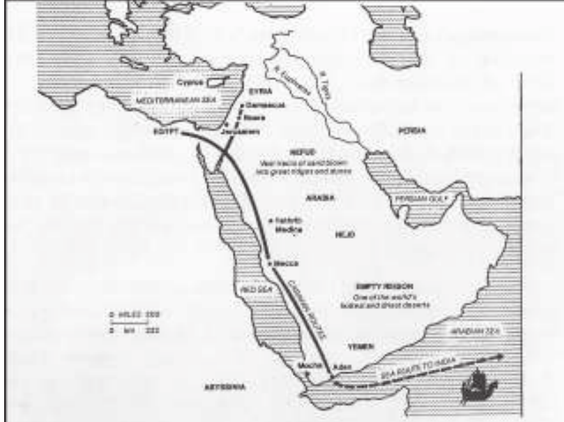
Trade route Arabian