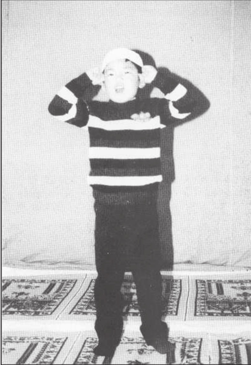
A boy saying Adhan

இவ்வாறு, ஹஸ்ரத் பிலால் (ரலி) அவர்கள் இஸ்லாத்தின் முதல் முஅத்தினாக அறியப்பட்டார்கள். ஒருவேளை, ஹஸ்ரத் பிலால் (ரலி) அவர்களால் பாங்கு சொல்லும் நேரம் பள்ளிக்கு வர இயலாமல் ஆகிவிட்டால், அபூமஹ்சூரா பாங்கு சொல்வார் என்றும், இவ்விருவரும் வரவில்லையென்றால், அம்ர் பின் உம்மே மக்தூம் (ரலி) அவர்கள் அப்பணியை செய்வார்கள் என்றும் ஹஸ்ரத் ரஸூல் (ஸல்) அவர்கள் அறிவுறுத்தினார்கள்.