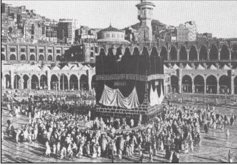
The Holy Ka'aba

இரண்டு மக்கத்துத் தலைவர்கள் கஅபா வளாகத்திற்குள் இருந்தனர். அப்போது ஏற்கெனவே இஸ்லாத்தை ஏற்றுக் கொண்ட அபூசுஃபியான் அவர்களுடன் பேசிக் கொண்டிருந்தார். அத்தாப்பின் உசைத், ஹாரிஸ் பின் ஹிஷாம் என்பது அவர்களது பெயர்களாகும். அவர்கள் கஅபா ஆலயத்திலுள்ள சிலைகளை, ஹஸ்ரத் பிலால் (ரலி) அவர்கள் அப்புறப்படுத்திக் கொண்டிருப்பதைக் கண்டார்கள். அவர் முக்கிய அறிவிப்புகள் செய்து கொண்டிருப்பதையும் அவர்கள் செவிமடுத்தார்கள். கைஅளவு பேரீத்தம் பழங்களுக்காக தனது எஜமானனின் ஆட்டு மந்தைகளை மேய்க்கும் ஒரு சாதாரண அடிமையாக மட்டுமே ஹஸ்ரத் பிலால் (ரலி) அவர்களைப் பற்றி அவர்களுக்குத் தெரியும். இஸ்லாத்தை ஏற்றுக் கொண்ட பிறகு, அவர் சுதந்திரமான மனிதர் மாத்திரம் அல்ல; நம்பிக்கைக்குரிய உயர்பதவியும் அதிகாரமும் அவருக்கு கொடுக்கப்பட்டு விட்டன.