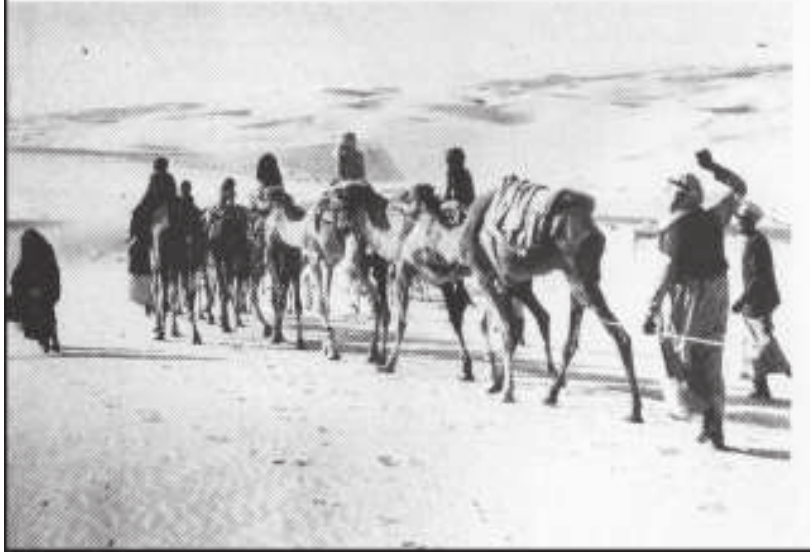
A camel caravan crossing the desert

மக்கத்தினர்கள் இதை அறிந்த போது, அவர்களை விரட்டிச் சென்று, அவர்களைப் பிடித்து திரும்பக் கொண்டுவர ஒரு குழுவை அனுப்பினர். இந்தக் குழு செங்கடல் இருக்கும் தூரம் வரையிலும் சென்றது. ஆனால், முஸ்லிம்கள் அதற்குள் ஒரு கப்பலில் ஏறி பயணிக்கத் தொடங்கி விட்டனர். எனவே, மக்கத்தினர்கள் ஏமாற்றத்துடன் மக்கா திரும்பினர். பின்னர், மக்கத்தினர், அபிசீனியா நாட்டு மன்னரிடம், அகதிகளாக வந்தவர்களை அவர்களிடம் ஒப்படைக்குமாறு இசையச்செய்ய, ஒரு தூதுக் குழுவை அங்கு அனுப்பினர். ஆனால், மன்னர் தமது நிலைப்பாட்டில் மிகவும் உறுதியாக இருந்தார். மக்கத்தினர்கள் அவரை வற்புறுத்திய போதிலும் முஸ்லிம்களை அவர்களிடம் ஒப்படைக்க அவர் மறுத்து விட்டார். மேலும் அவர், முஸ்லிம்களை தன் ஆட்சியின் கீழ் எவ்வித அடக்குமுறையும் இன்றி வாழ அனுமதித்தார்.