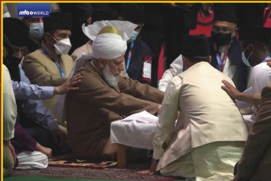
உலகளாவிய பைஅத் நிகழ்ச்சி