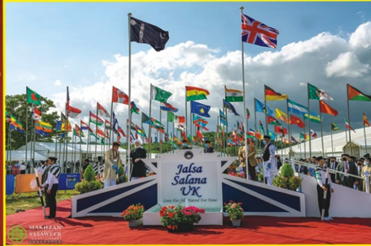
ஹுஸூர் அவர்கள் கொடியேற்றும் காட்சி