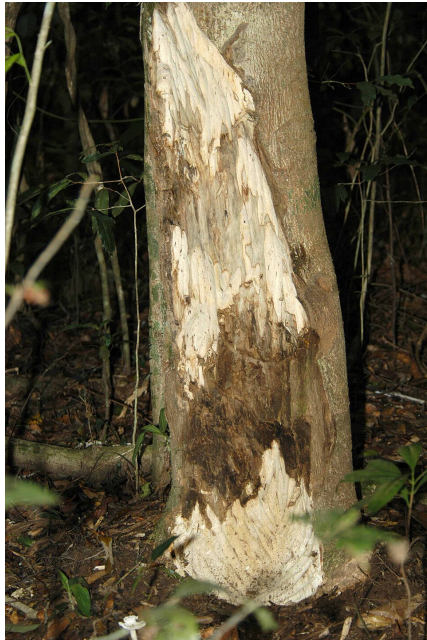
عود کا درخت (Agarwood)

”العجم الوسیط میں آیا ہے کہ یہ ایک سخت مادہ ہے جس کا نہ ذائقہ ہے نہ خوشبو، مگر جب اسے کوٹا یا جلایا جائے تو خوشبو دیتا ہے۔ کہا گیا ہے کہ یہ ایک سمندری جانور کا فضلہ ہے جو حوت کی قسم سے ہے، وہی یہ مادہ خارج کرتا ہے۔“ (نہایۃ الآرب فی فنون الأدب، از شہاب الدین احمد النوری، جلد 12 صفحہ 10 تا 13، القسم الخامس مطبوعہ دارالکتب العلمیہ بیروت لبنان 2004ء) عنبر کو زیورات میں نگینہ کے طور پر بھی استعمال کیا جاتا ہے اور اس کو کوٹ کر یا جلایا کر اس کا صوف خوشبوؤں میں بھی استعمال کیا جاتا رہا ہے اور کیا جاتا ہے۔