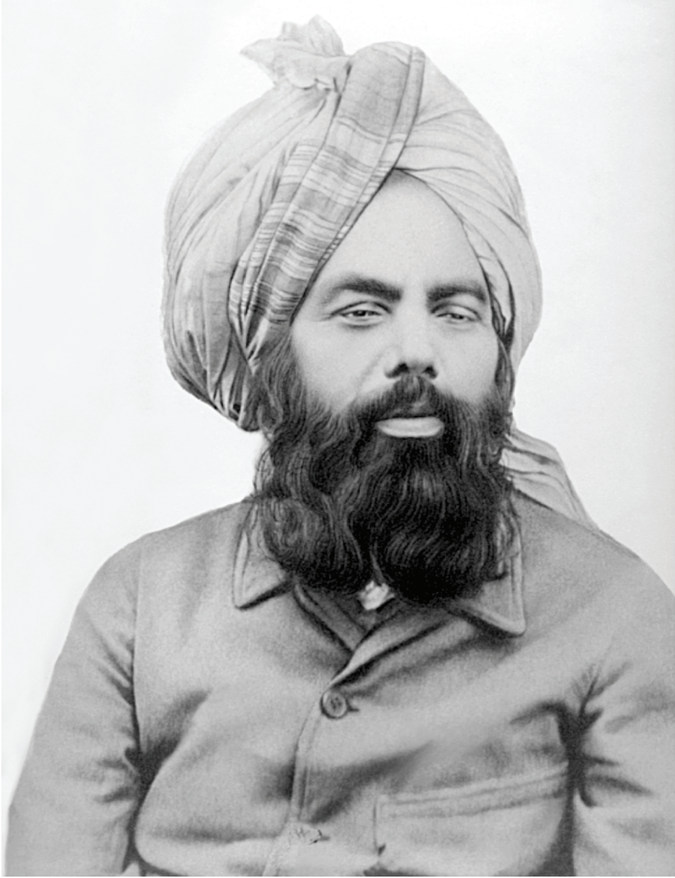
हज़रत मिर्ज़ा गुलाम अहमद साहिब क़ादियानी मसीह मौऊद व महदी माहूद अलैहिस्सलाम (1835 ई० - 1908 ई०) संस्थापक अहमदिया मुस्लिम जमाअत